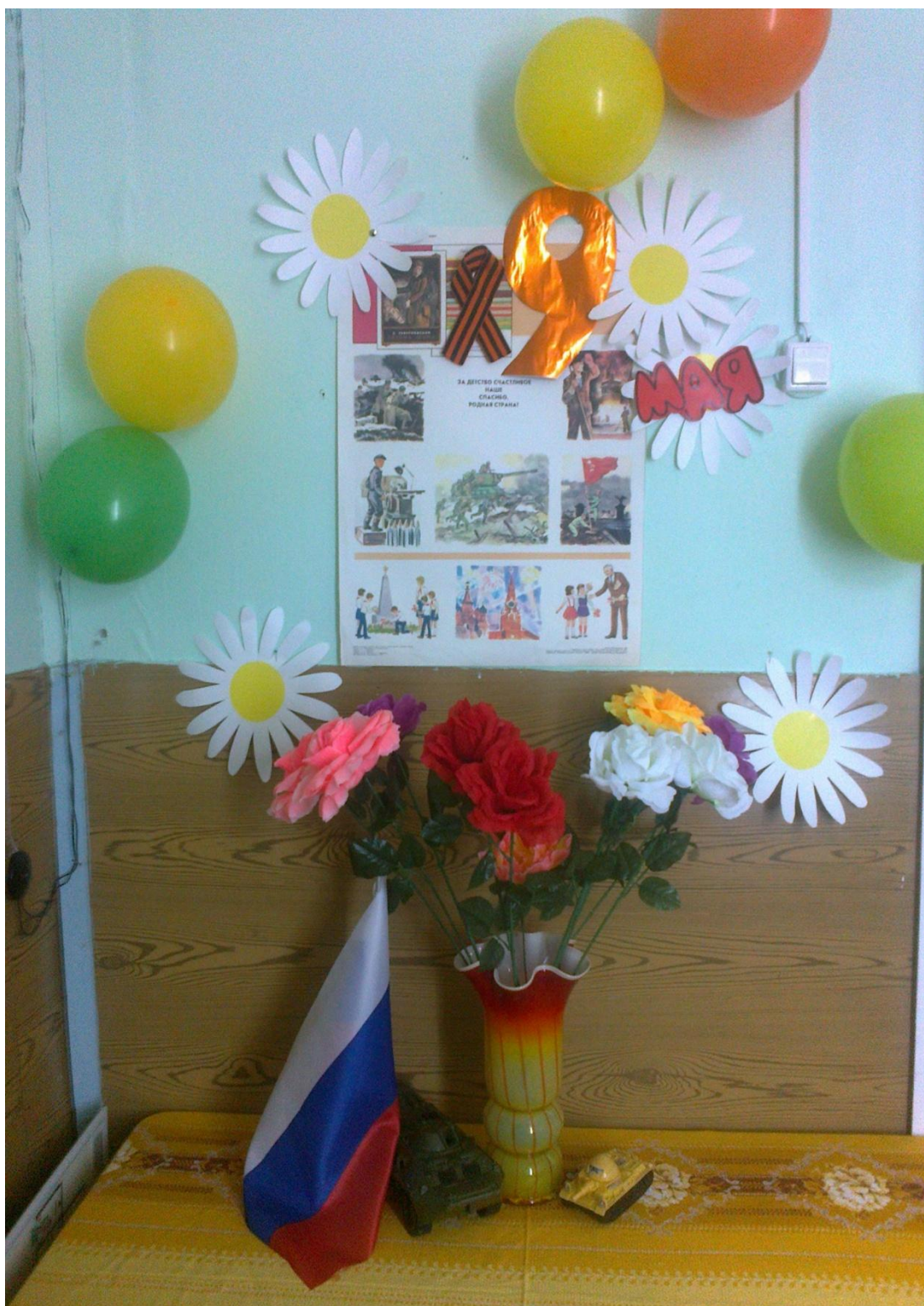
Оформление фойе младшей группы