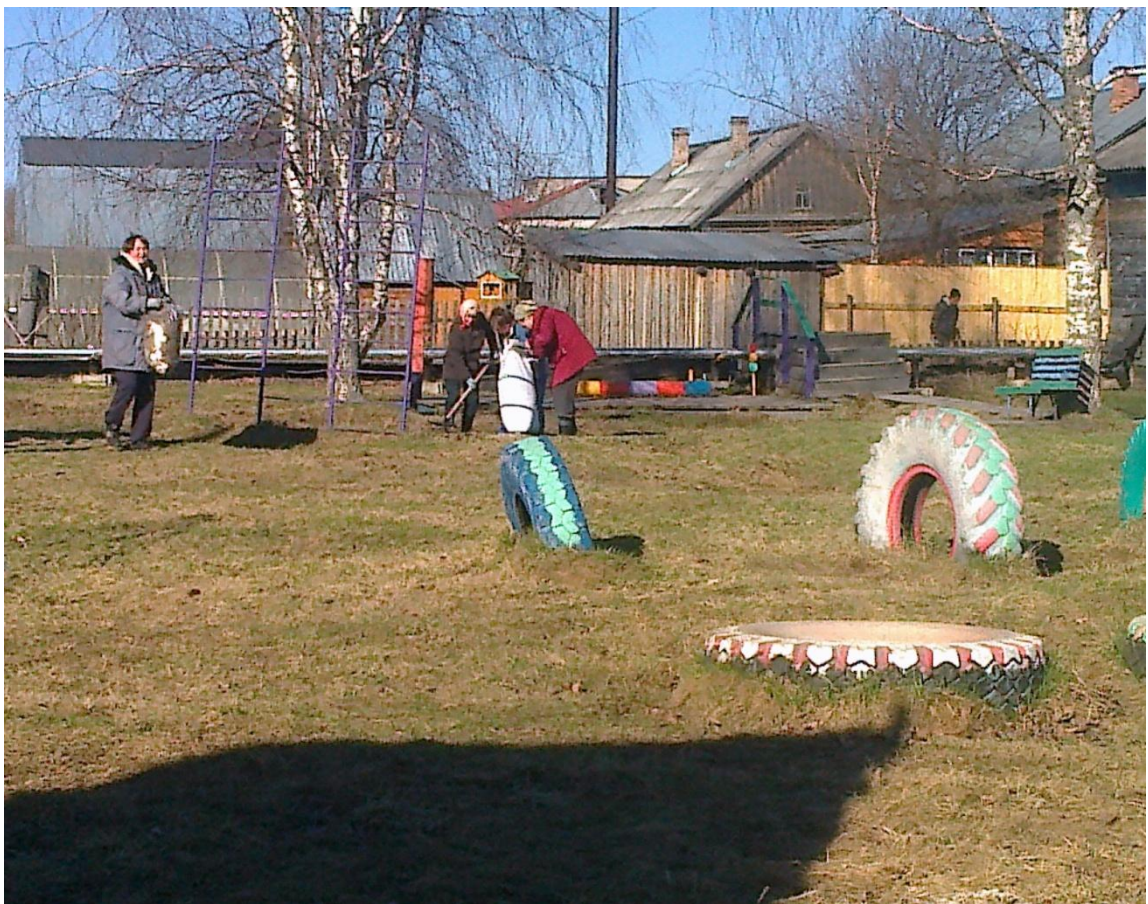
На уборке территории: коллектив ДОУ, родители и дети.