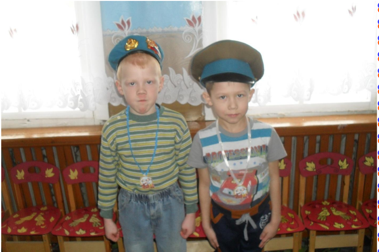
Спортивный досуг «Мы – защитники Отечества»